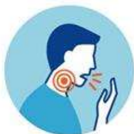
КАШЕЛЬ И/ИЛИ БОЛЬ В ГОРЛЕ