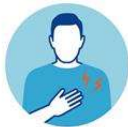
БОЛЬ В МЫШЦАХ