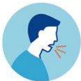
ВОЗДУШНО- КАПЕЛЬНЫЙ ПУТЬ

Через зараженные поверхности – рукопожатия, поручни в транспорте, дверные ручки, другие предметы и поверхности.