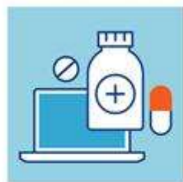
НЕ ЗАНИМАЙТЕСЬ САМОЛЕЧЕНИЕМ